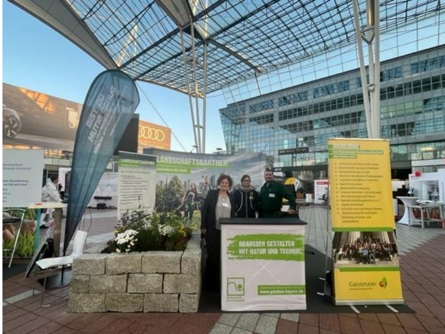
Gaissmaier GartenLandschaft GmbH & Co. KG