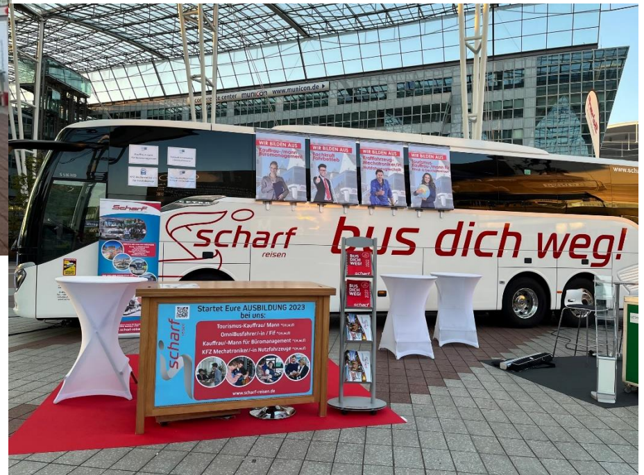
Scharf OHG Omnibus & Reisebüro