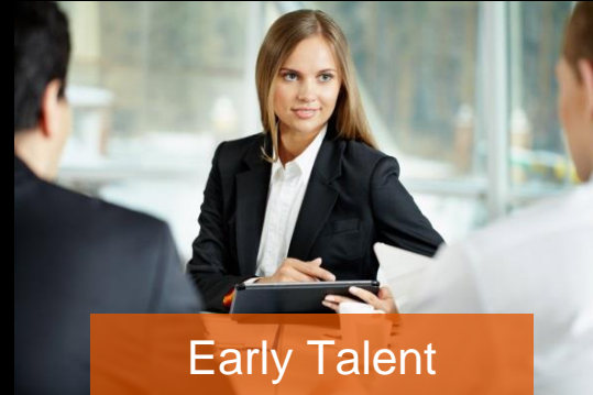
Early Talent Program