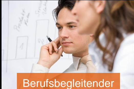
Berufsbegleitender Master bei SAP